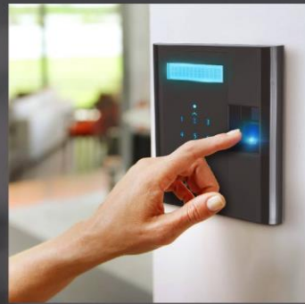
CONTROLE DE ACESSO