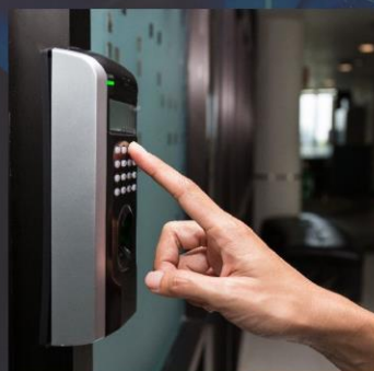
CONTROLE DE ACESSO